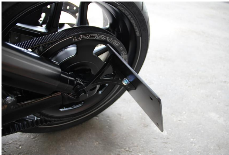
Abb.2 montierter Kennzeichenhalter