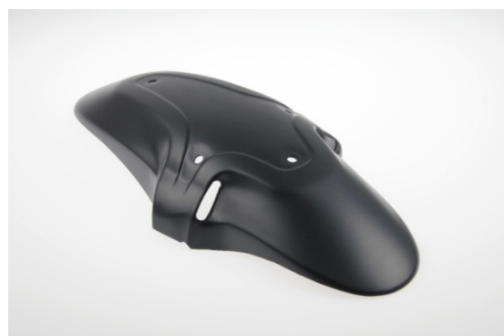
Abb. 2 - Frontfender "Special"