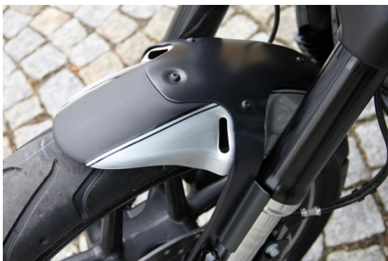
Abb. 1 - montierter Frontfender

Wir empfehlen, für alle Schrauben eine mittelfeste Schraubensicherung (z.B. LOCTITE 243, blau) zu verwenden.