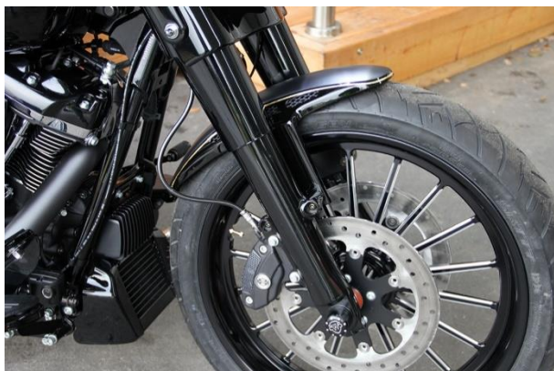
Abb. 1 - montierter Frontfender

Wir empfehlen, für alle Schrauben eine mittelfeste Schraubensicherung (z.B. LOCTITE 243, blau) zu verwenden.