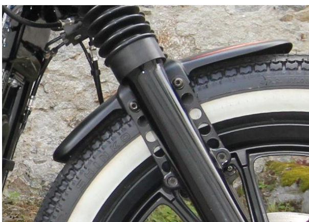
Abb.: 1 - Frontfender montiert, Ansicht von RE

Wir empfehlen, für alle Schrauben eine mittelfeste Schraubensicherung (z.B. LOCTITE 243, blau) zu verwenden.