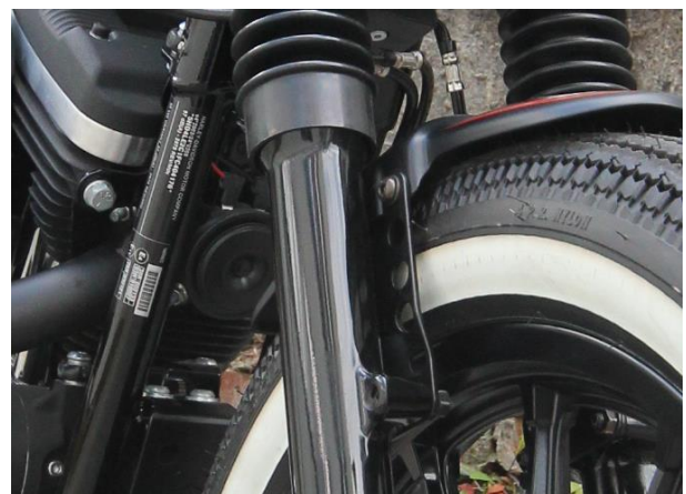
Abb.: 2 - Frontfender montiert, Ansicht von RE vorne