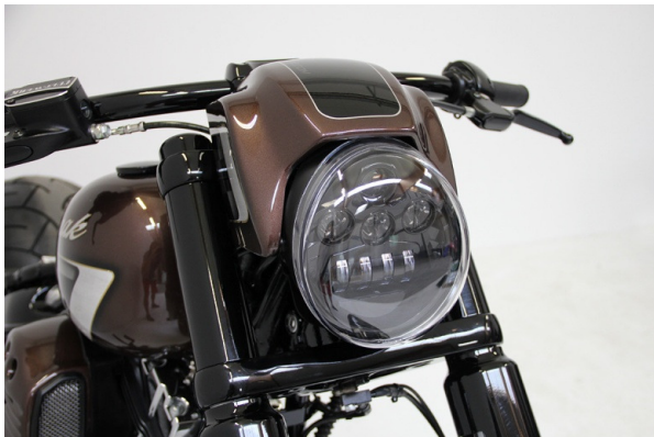
Abb. 1 – montiertes Scheinwerferkit

Wir empfehlen, für alle Schrauben eine mittelfeste Schraubensicherung (z.B. LOCTITE 243, blau) zu verwenden.