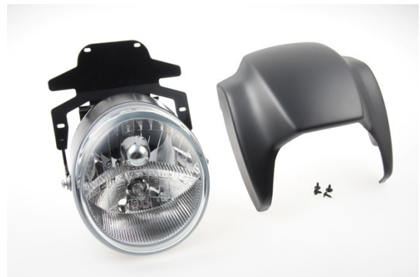
Abb. 2 – Scheinwerferkit „Night-Rod“ mit Halter