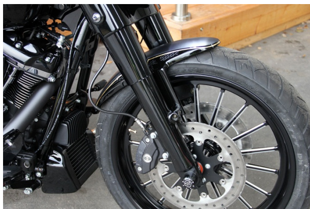
Abb. 1 - montierter Frontfender

Wir empfehlen, für alle Schrauben eine mittelfeste Schraubensicherung (z.B. LOCTITE 243, blau) zu verwenden.