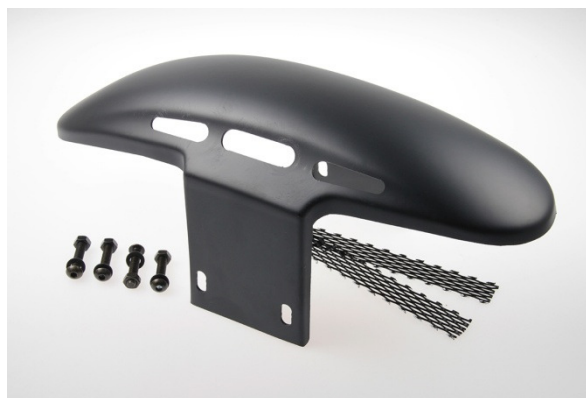
Abb. 2 - Frontfender "Custom" V2