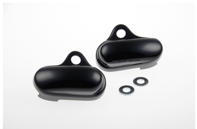
Abb. 2 – Achscover hinten