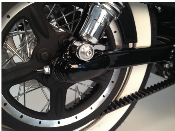
Abb. 1 – montierte Achscover