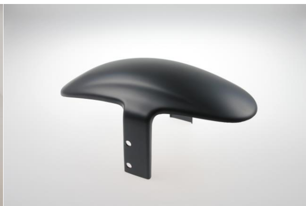
Abb. 2 - Frontfender "Custom" V1