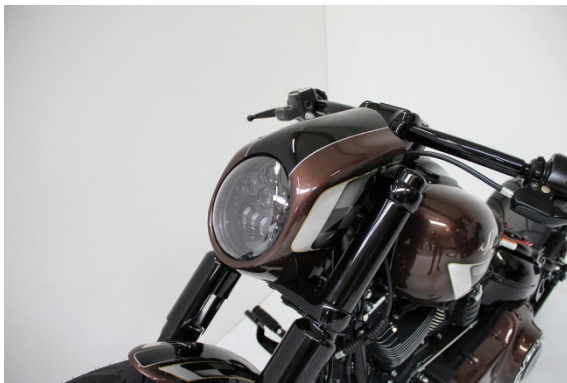
Abb. 1 – montiertes Scheinwerferkit

Wir empfehlen, für alle Schrauben eine mittelfeste Schraubensicherung (z.B. LOCTITE 243, blau) zu verwenden.