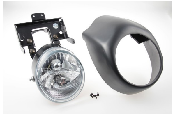
Abb. 2 – Scheinwerferkit „Night-Rod“ mit Halter