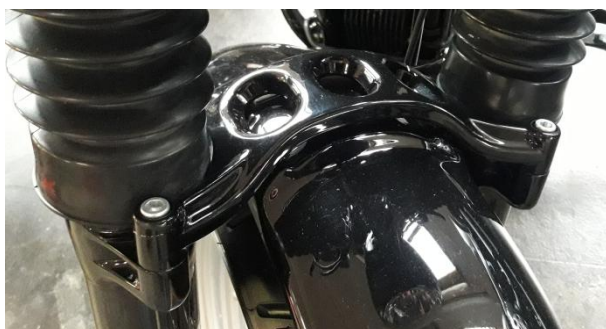
Abb. 1 - montierter Frontfender