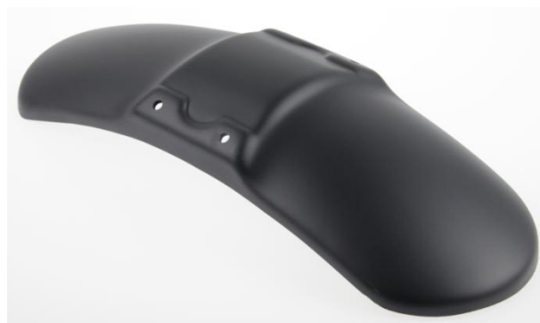
Abb. 2 - Frontfender "Bobber" (8)