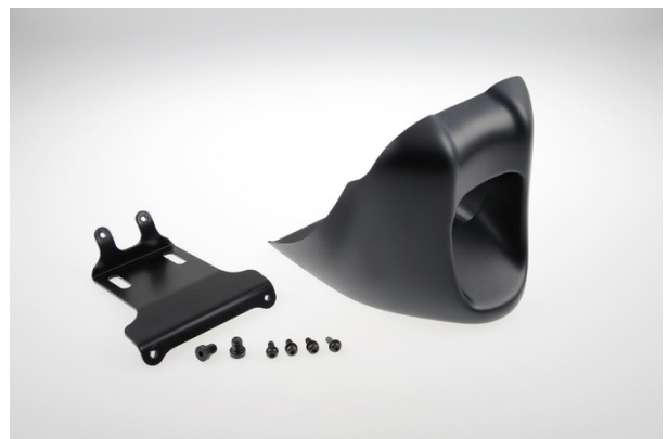
Abb. 2 – Bugspoiler „Bobber“