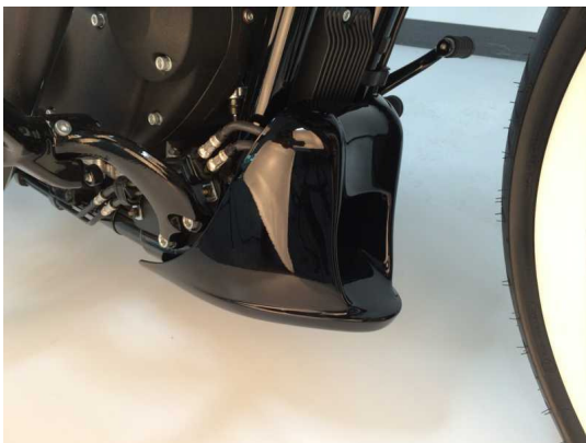
Abb. 1 – montierter Bugspoiler

Wir empfehlen, für alle Schrauben eine mittelfeste Schraubensicherung (z.B. LOCTITE 243, blau) zu verwenden.