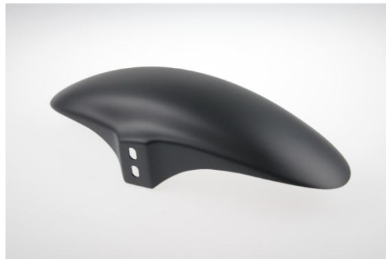
Abb. 2 - Frontfender „GT“