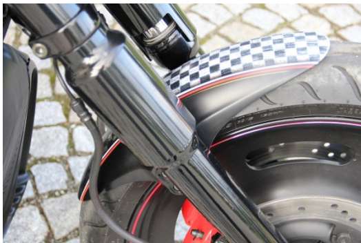
Abb. 1 – montierter Frontfender „GT“