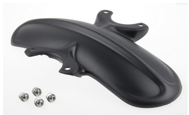
Abb. 2 - Frontfender "Old School" (8) inkl. Montagmaterial