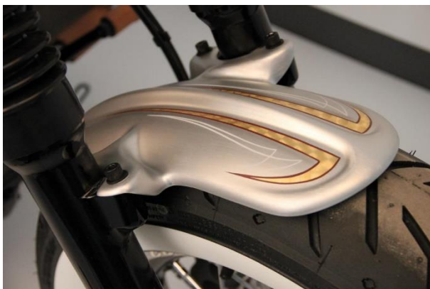
Abb. 1 - montierter Frontfender Beispielfoto, lackierte Ausführung