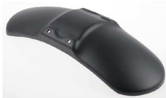
Abb. 2 - Frontfender "Bobber" (8)