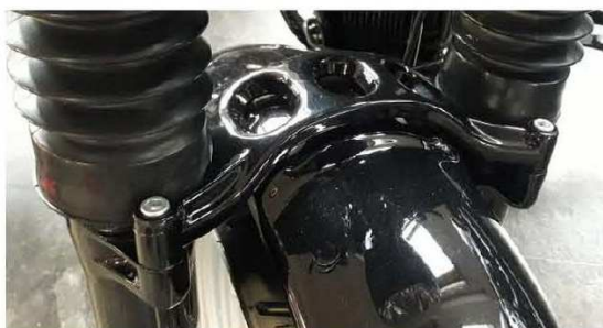
Abb. 1 - montierter Frontfender