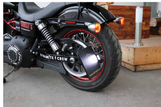
Abb. 5: montierter Kennzeichenhalter