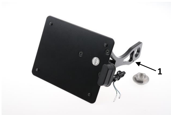
Abb. 4: seitlicher Kennzeichenhalter mit Klemmmutter