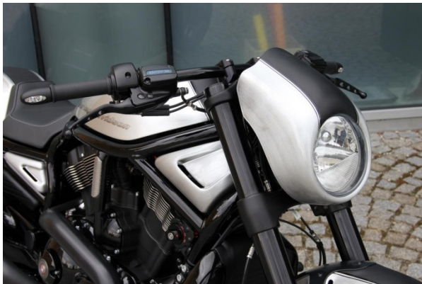
Abb. 1 – montierte Scheinwerfermaske

Wir empfehlen, für alle Schrauben eine mittelfeste Schraubensicherung (z.B. LOCTITE 243, blau) zu verwenden.