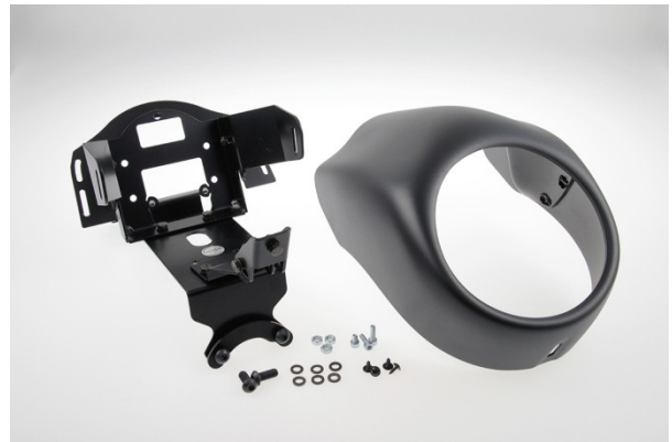
Abb. 2 – Scheinwerfermaske „Special“ mit Halter