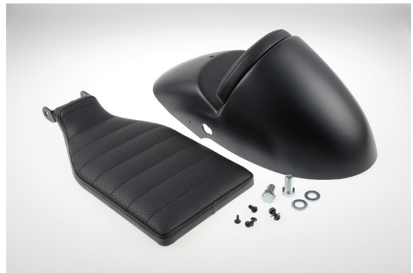
Abb. 2 – Heckfender „Cafe Racer“