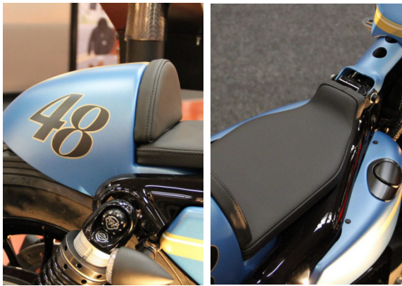
Abb. 1 – montierter Fender

Wir empfehlen daher die Montage eines seitlichen Kennzeichenhalters (HD-SPO012), der Rahmenabdeckung (HD-SPO032) und eines 3-in-1 Blinkersets (z.B.HD-SPO032) inkl. Halterungen (HD-SPO022)