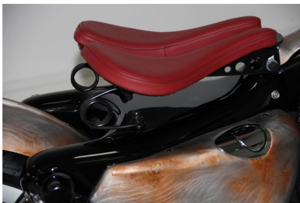
Abb. 1 – montierte Rahmenabdeckung

Wir empfehlen, für alle Schrauben eine mittelfeste Schraubensicherung (z.B. LOCTITE 243, blau) zu verwenden.