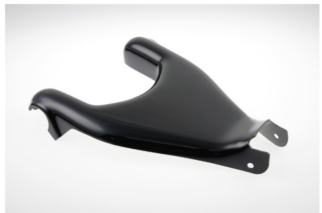
Abb. 2 – Rahmenabdeckung lang