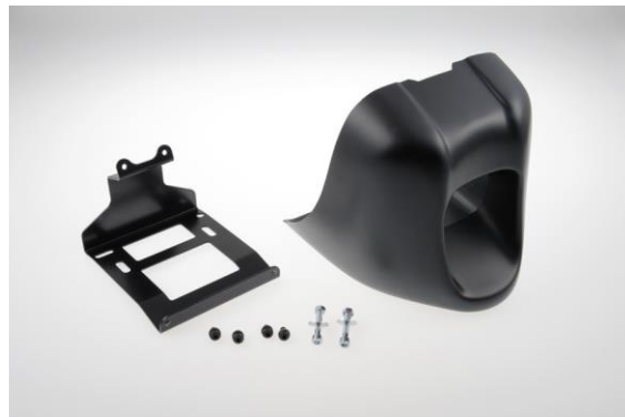
Abb. 2 – Bugspoiler Racing