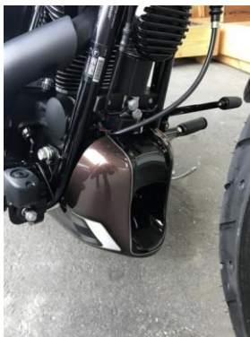
Abb. 1 – montierter Bugspoiler

Wir empfehlen, für alle Schrauben eine mittelfeste Schraubensicherung (z.B. LOCTITE 243, blau) zu verwenden.