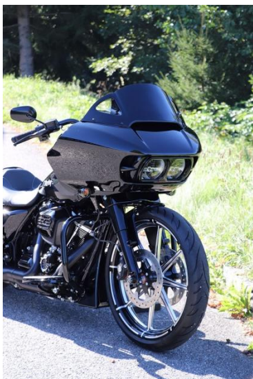
Abb. 1 – montiertes Windschild