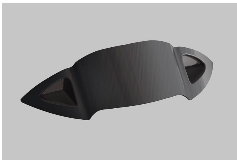
Abb. 2 – Windschild „Racing“