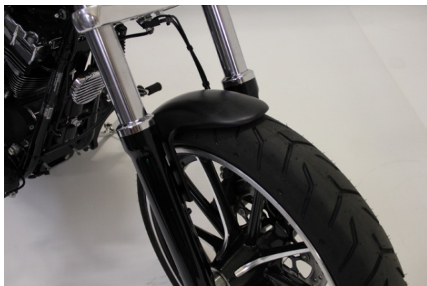
Abb. 1 - montierter Frontfender

Wir empfehlen, für alle Schrauben eine mittelfeste Schraubensicherung (z.B. LOCTITE 243, blau) zu verwenden.