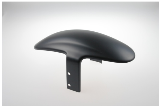
Abb. 2 - Frontfender "Custom" V1