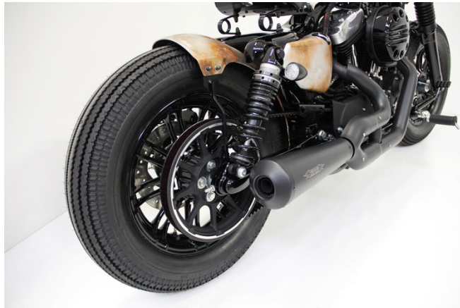
Abb. 2 – montiertes Heck

Wir empfehlen daher die Montage eines seitlichen Kennzeichenhalters (HD-SPO012), einer Rahmenabdeckung (HD-SPO073) und eines 3-in-1 Blinkersets (z.B. HD-SPO032) inklusive Halterungen (HD-SPO022)