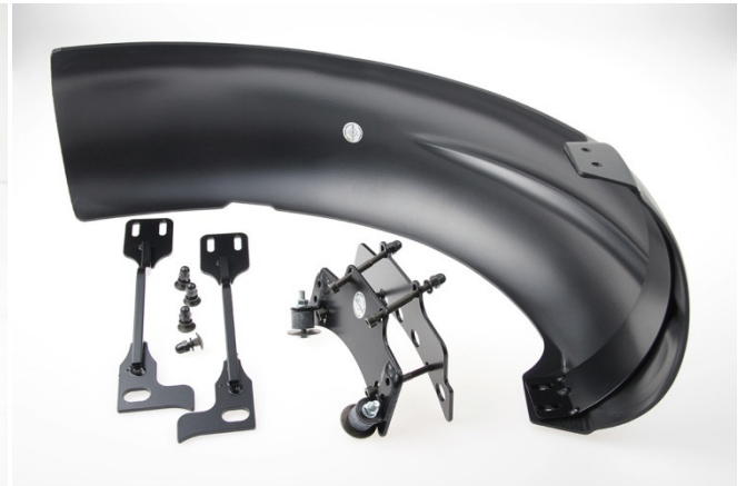
Abb. 3 – mitschwingendes Heck inkl. Montagmaterial