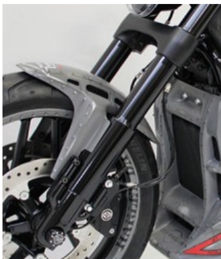
Abb. 1 - montierter Frontfender