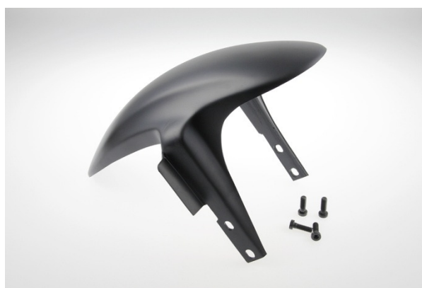
Abb. 2 - Frontfender "Custom"