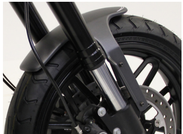
Abb.: 2 - Frontfender montiert