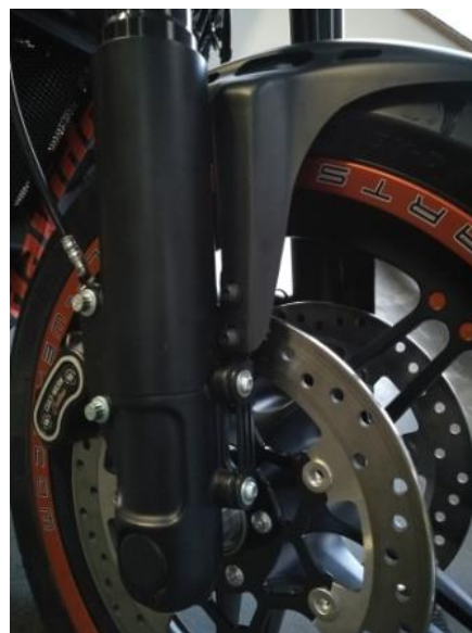
Abb.3 – montierter Frontfender „Custom“