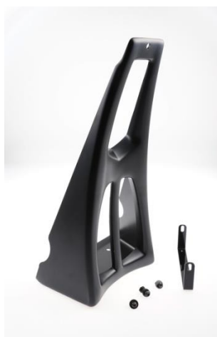
Abb. 2 - Bugspoiler "Custom"