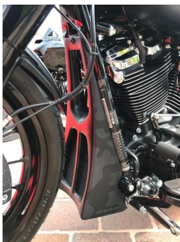
Abb. 1 - montierter Bugspoiler

Wir empfehlen, für alle Schrauben eine mittelfeste Schraubensicherung (z.B. LOCTITE 243, blau) zu verwenden.