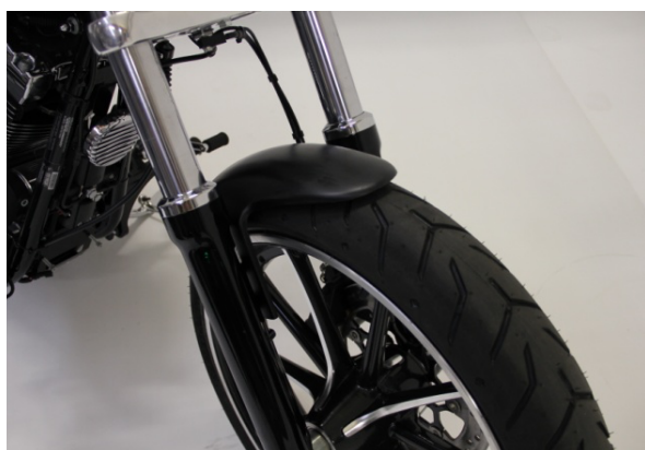
Abb. 1 - montierter Frontfender

Wir empfehlen, für alle Schrauben eine mittelfeste Schraubensicherung (z.B. LOCTITE 243, blau) zu verwenden.