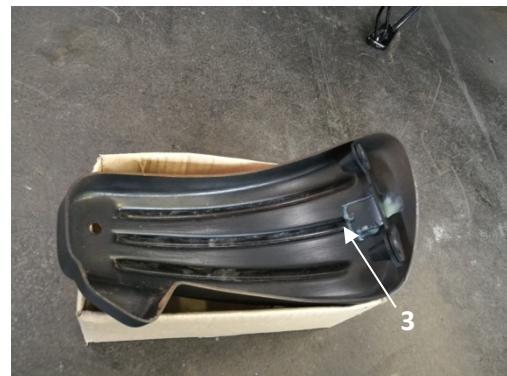
Abb.1, Seitendeckel links