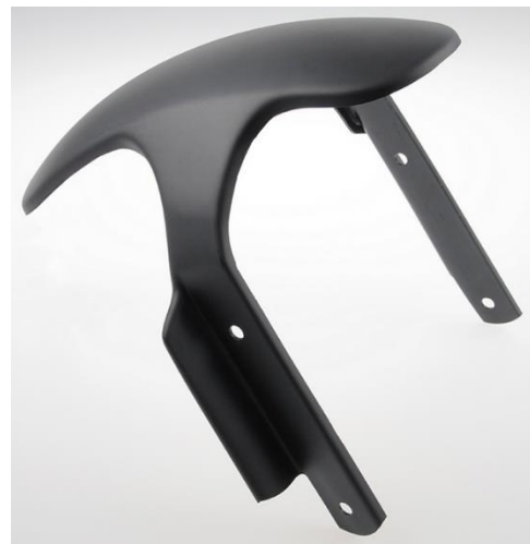
Abb.: 2 - Frontfender Roadster