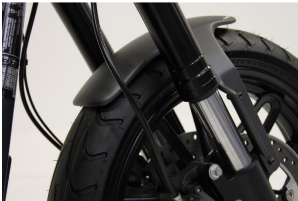
Abb.: 1 – Frontfender montiert

Wir empfehlen, für alle Schrauben eine mittelfeste Schraubensicherung (z.B. LOCTITE 243, blau) zu verwenden.