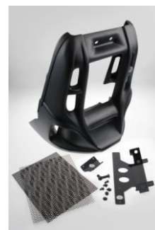
Abb. 4– Kühlerverkleidung inkl. Montagematerial