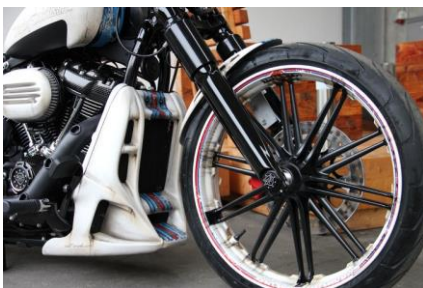
Abb. 3 – montierte Kühlerverkleidung

Wir empfehlen, für alle Schrauben eine mittelfeste Schraubensicherung (z.B. LOCTITE 243, blau) zu verwenden.